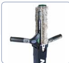
Voor links- en rechtshandigen