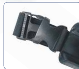
Clip-sluiting voor snelle bevestiging aan de riem.